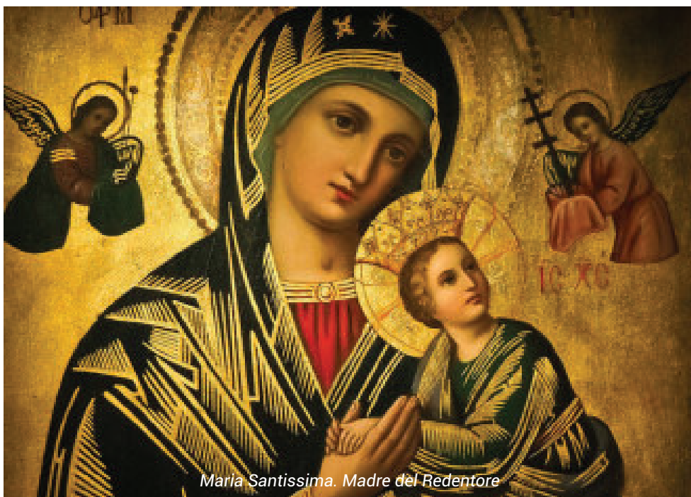
Maria Santissima. Madre del Redentore

Secondo il vangelo di Luca, la vita di Gesù fu tutta una lenta e inarrestabile salita verso Gerusalemme, dove avrebbe consumato il suo esodo (Lc 9,31). Parallelo a questo cammino di Gesù, anche per Maria il mistero della Pasqua cominciò con le parole di Simeone che le richiamava la spada che avrebbe trafitto l'anima. A riguardo Giovanni Paolo II, nella Redemptoris mater applica alla vita