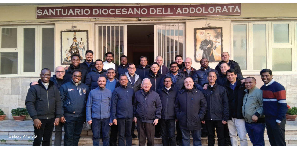
I Missionari dei Sacri Cuori in Italia

Nei disegni di Dio Gaetano Errico non era destinato ad essere una cometa nel firmamento della Chiesa; egli non era, mi si perdonino le espressioni, il santo di passaggio, il santo casuale, il cristiano edificante destinato ad impressionare in un luogo determinato e ristretto, la sua generazione. Egli era una stella destinata a rimanere nel firmamento, come segno permanente di un messaggio di Dio. Egli era un albero piantato non per durare una stagione, ma per diventare secolare e garantire frutti per generazioni e generazioni e dar vita ad altri alberi da trapiantare laddove c'era la necessità di diffondere il messaggio originale di cui egli era portatore. Egli non era il predicatore da ricordare con nostalgia