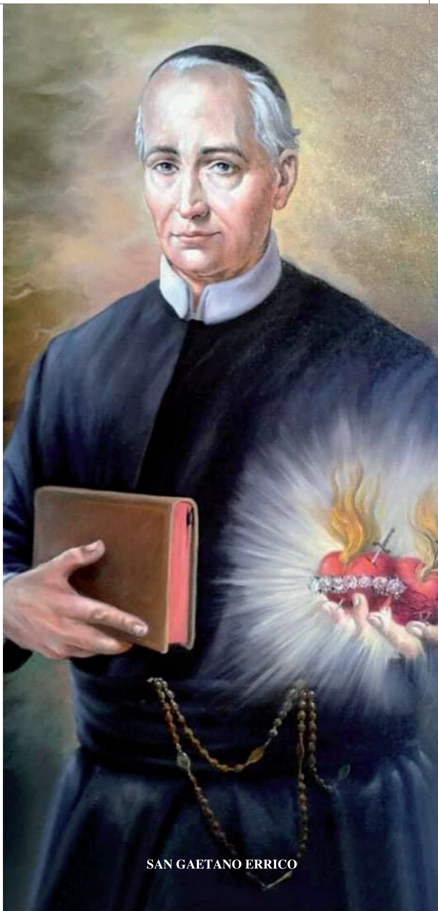
SAN GAETANO ERRICO