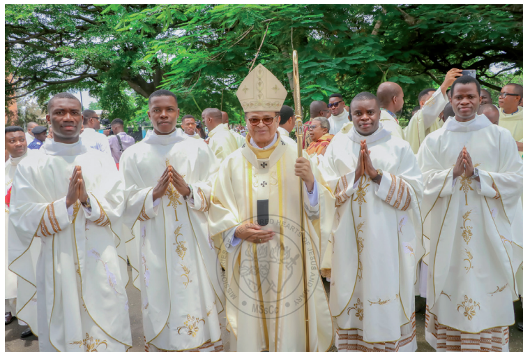
I quattro novelli sacerdoti con il Vescovo ordinante