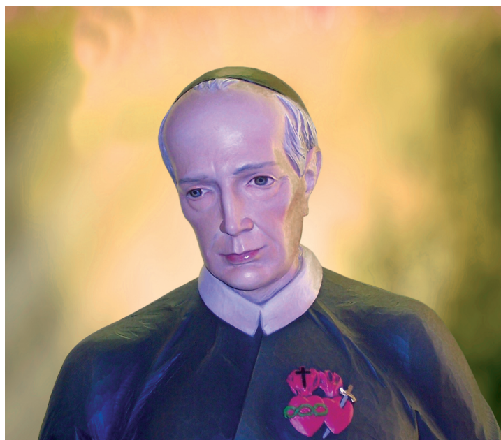
SAN GAETANO ERRICO